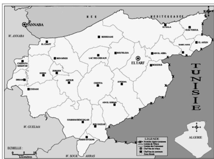
Figure 1 : Situation géographique de la région d'El Tarf.

La région est caractérisée par sa vocation agricole et un développement industriel relativement peu important (une dizaine d'unités industrielles).